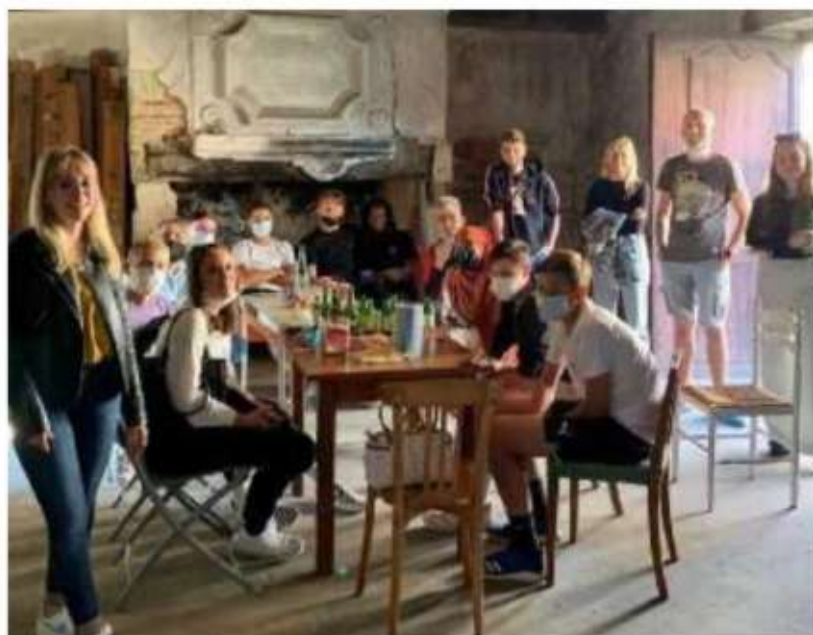
Une première réunion a eu lieu en juillet afin de poser les bases de ce projet qui associe les jeunes de la Classe pontoise. L.B.

La première étape consiste à réaliser un diagnostic sur les besoins et attentes des jeunes de 16 à 30 ans concernant leur autonomie, leur possibilité d'entreprendre et leur engagement citoyen en territoire rural.