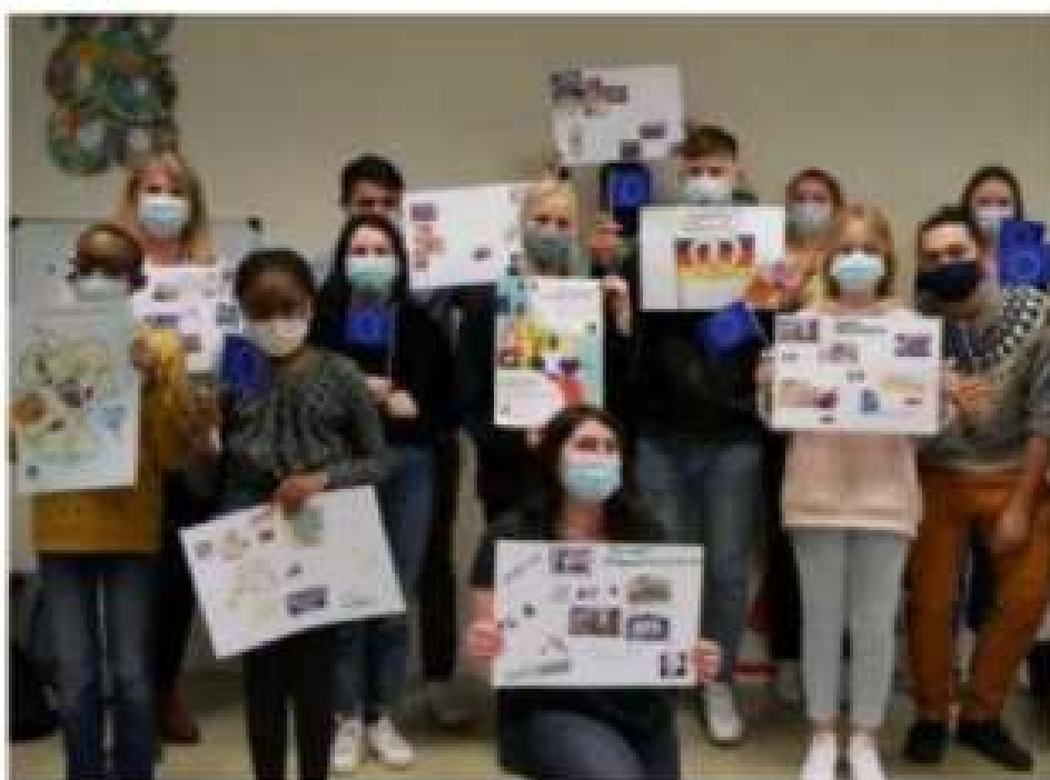
La jeunesse européenne, dans toute sa diversité, se retrouvera dans ce Joli mois de l'Europe, du 5 au 27 mai. L. B.